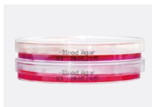
可直接在培养皿边缘做标记