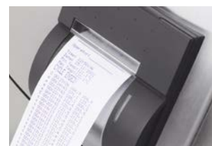
Systemec培养基制备可选配打印机用于打印记录的文档