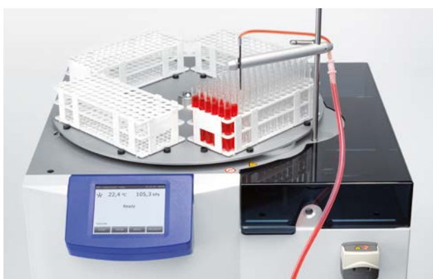
Remplisseuse de tubes Systec