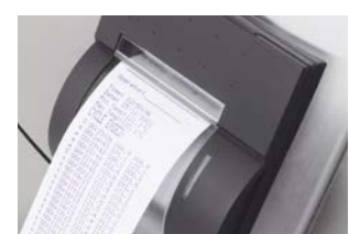
Imprimante Systec Mediaprep pour la documentation