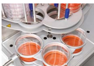
Systec Mediafill avec boîtes de Petri