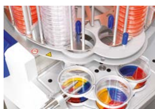
Systec Mediafill avec boîtes à 3 compartiments