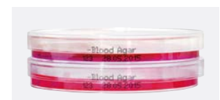
Étiquetage latéral des boîtes de Petri